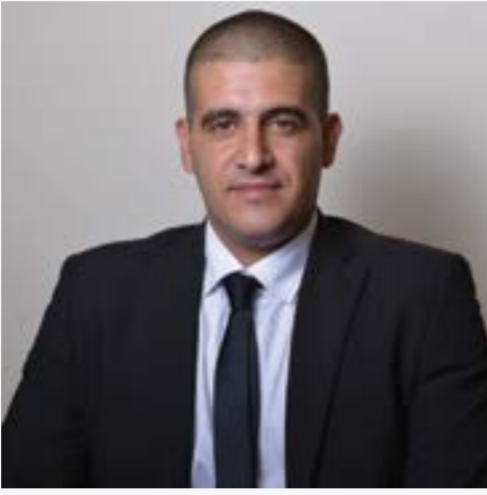
עו"ד, שותף בכיר